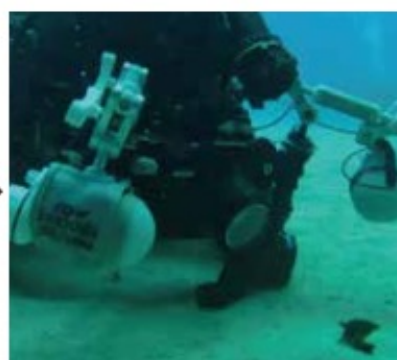
シャッターを切るとプレ発光を感じて一瞬消灯し、再点灯。撮影結果に赤色光は映り込みません