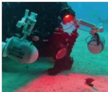
レッドフィルターによる赤色光でフォーカシング